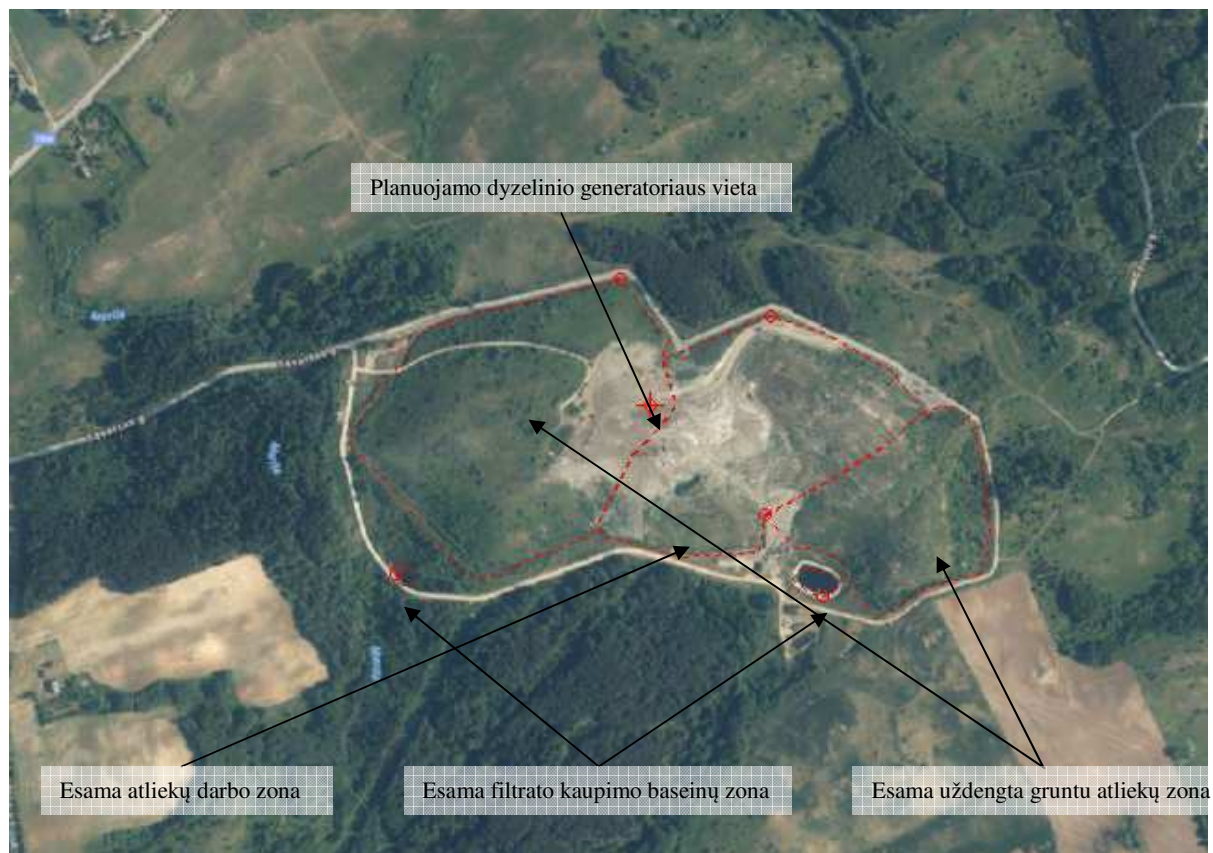
Pav. 4. Lapių regioninio sąvartyno esamų ir planuojamų kvapo šaltinių išdėstymo schema