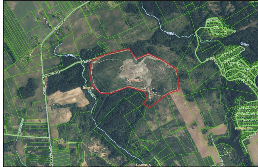
1 pav. PŪV sklypo situacijos schema ( www.registrucentras.lt )

Pelenų (šlako) apdorojimo aikštelė numatyta ant Lapių regioninio sąvartyno II kaupo (1, 2 pav.). Pelenų (šlako) laikymo ir apdorojimo aikštelė užims iki 4 ha (pirmas etapas 2 ha, antras etapas 1.79 ha). Vieta ir aikštelės išsidėstymas pateikti 1, 1a, 1b pav.