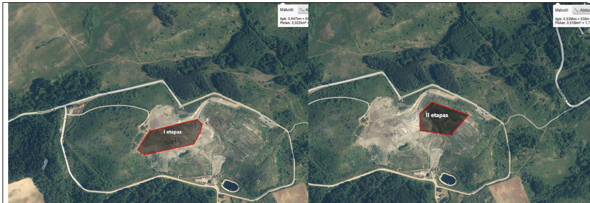
1a pav. Pelenų (šlako) aikštelės (I etapas) situacijos schema